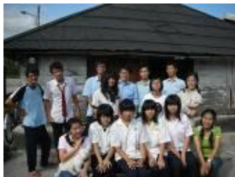
五味屋的團隊成員

我們不期望五味屋是「千年暗室、一燈即明」的那盞燈，在這破舊的老屋子裡，我們只是「為孩子的平衡人生播下種子」。